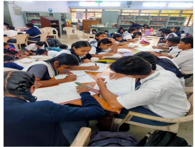
चित्रकला प्रतियोगिता / Drawing Competition