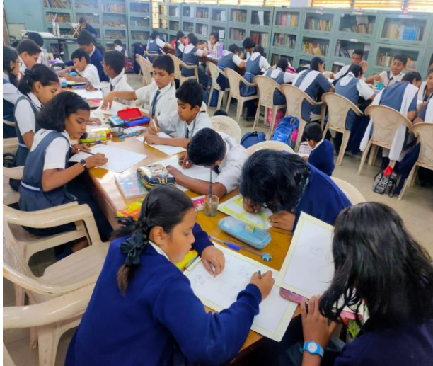
चित्रकला प्रतियोगिता / Drawing Competition